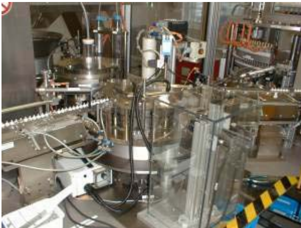
Ausschnitt Montagelinie eines Herstellers

Bei der Herstellung von Disposables und Medical Devices für die pharmazeutische Industrie wird ein Höchstmass an qualitativer Sicherheit gefordert. Dies zu erreichen fordert nicht nur ein interdisziplinäres Zusammenarbeiten von allen Beteiligten, darüber hinaus müssen auch klar definierte Abläufe und Vorgaben beginnend mit der Planung einer Produktionsanlage bis hin zum endgültigen Inverkehrbringen der Produkte eingehalten werden.